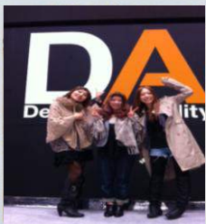
最後にステージの上にて 記念撮影!!