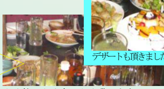
デザートも頂きました♪