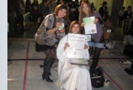
競技開始間隙に記念撮影