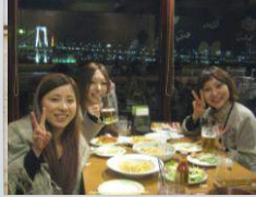
レインボーブリッジを バックにお台場でディナー