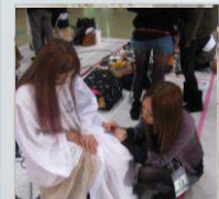
つけ爪つけています

こんな感じでサロンワークのほかにも大会に出場したり、講習会に行ったりと楽しく 活動しております \^o^/