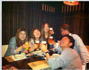
応援に来てくださった方達と 大会終了後 新橋でお疲れ様会