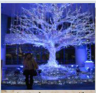
イルミネーションが とてもキレイでした