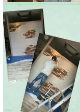
店内リニューアル 10月31日~11月2日

リニューアル工事の期間を利用して聖竜町でミーティング合宿!!! 今年の自分を振り返り将来の夢や目標を立て、皆の前で発表したり、来年の計画を立てました 一泊二日! 頭をフル活動した時間でした。