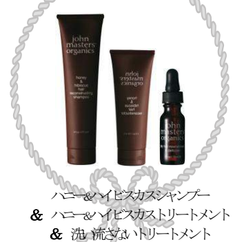
ハーニー&イビスカスシャンプー & ハーニー&イビスカストリートメント & 洗流さないトリートメント