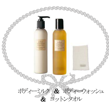
ボディミルク & ボディーウォッシュ & コットンタオル