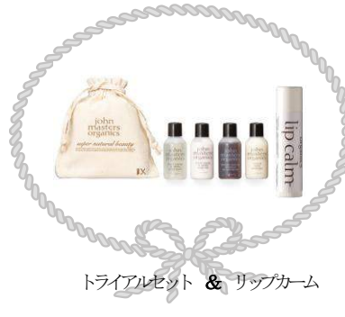
トライアルセット & リップカーム