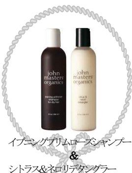
イブニングプリムローズシャンプー & シトラス&ネロリデタングレー